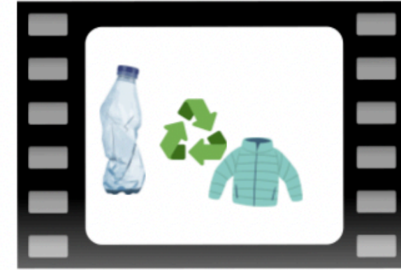
Grafica (il riciclo di 52 bottiglie fanno 1 giacca)