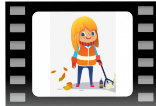
Ragazza raccoglie rifiuti e li butta in un cassone