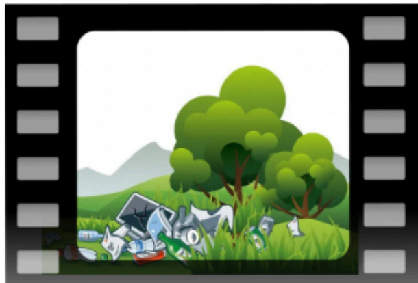
Rifiuti per terra in vari luoghi