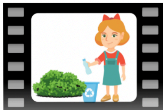
Ragazza raccoglie la bottiglia buttata dal ragazzo ad inizio video e la butta nel cestino