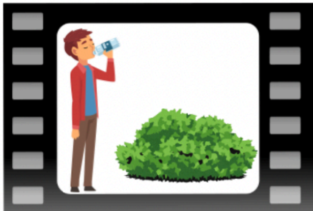
Ragazzo beve dalla bottiglia e la butta nella natura